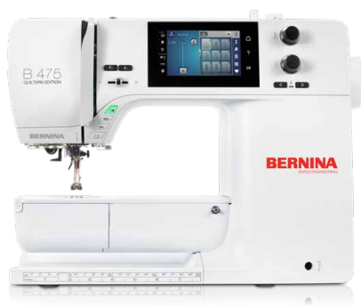
BERNINA 475 QE